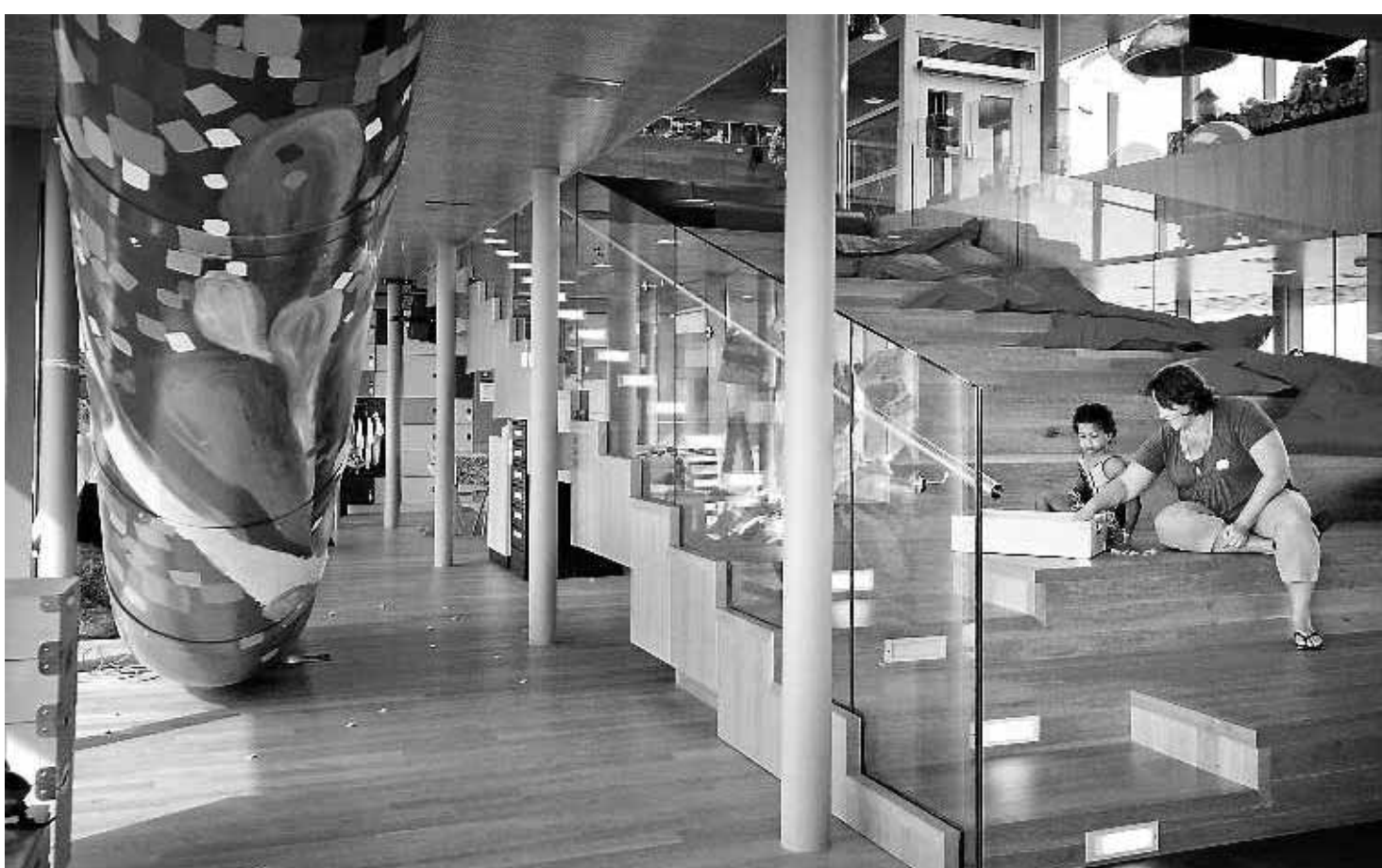
Een 'genezend' interieur op de kinderafdeling van het VU-ziekenhuis.