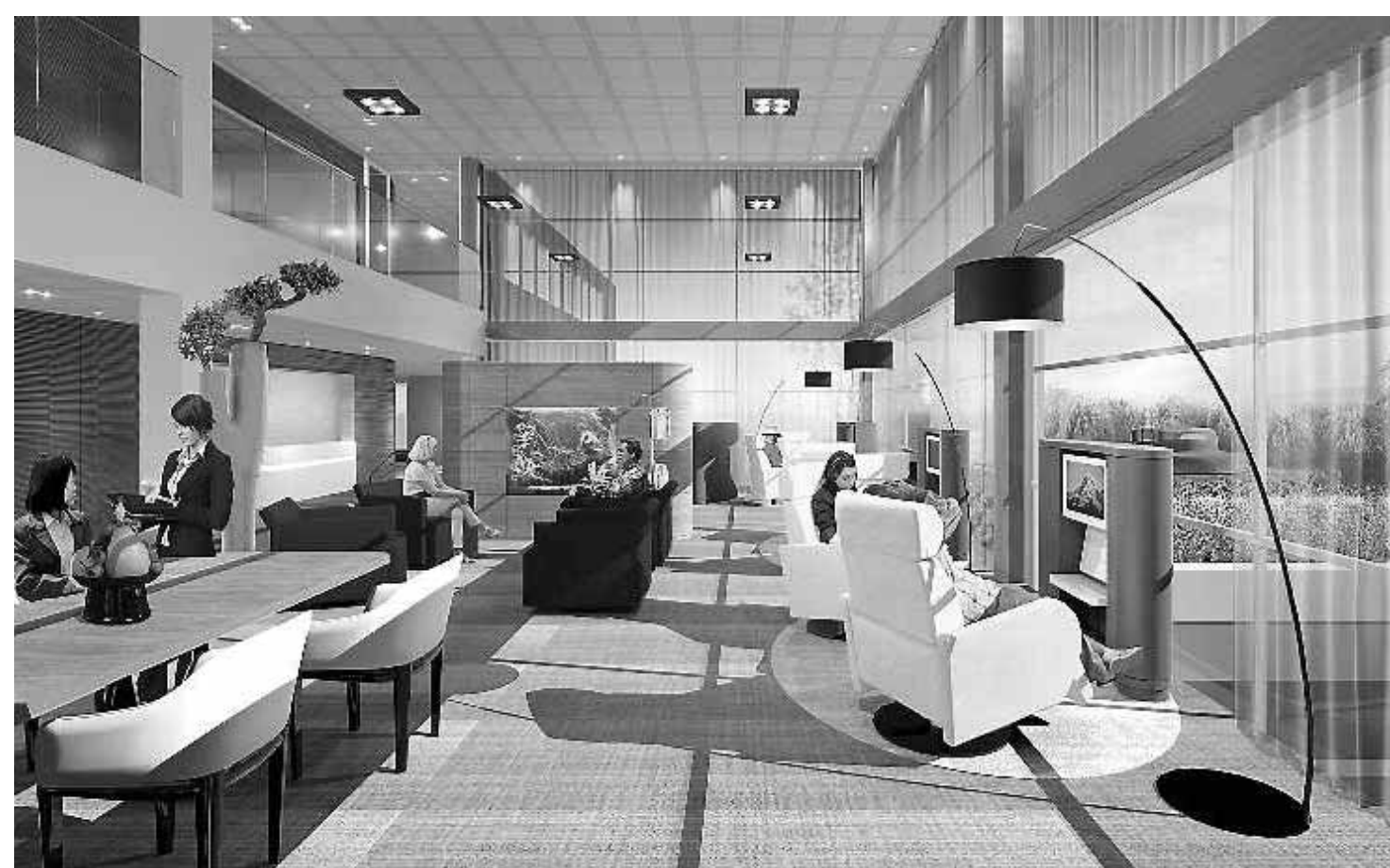
Een artist impression van een zogenaamd genezende omgeving.